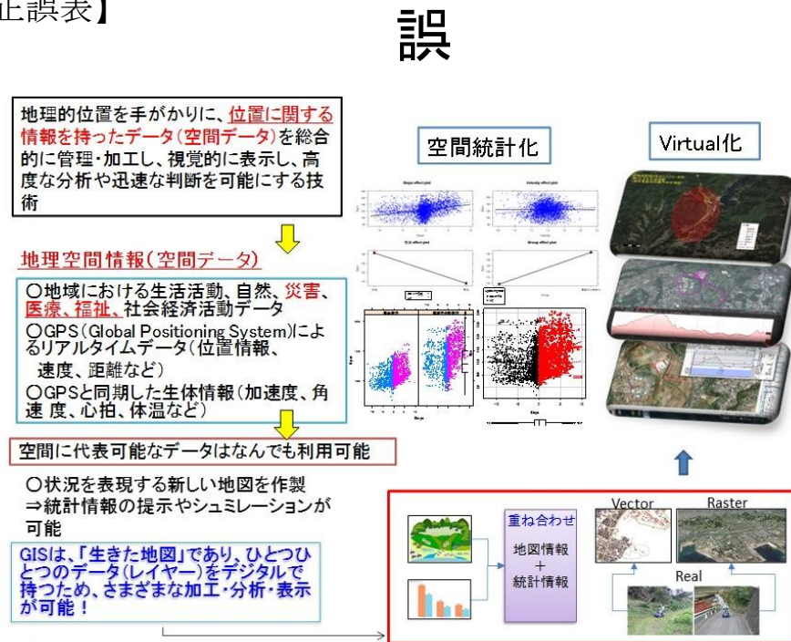
図6 GPSデータの処理過程